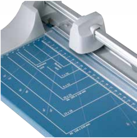
Des tracés de formats pratiques facilitent l'alignement du matériau à couper