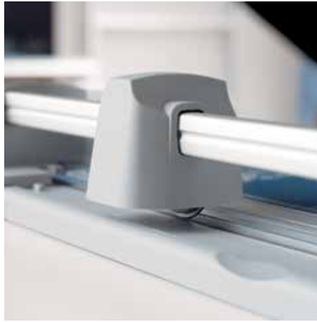
Tête de coupe fermée pour une utilisation sûre de la cisaille