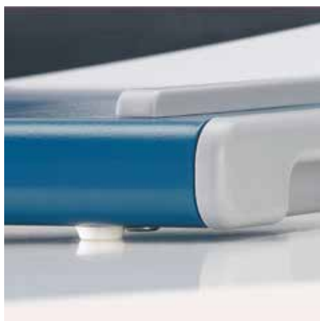
Pieds en caoutchouc antidérapants pour une tenue sûre