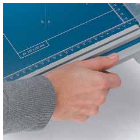
Des poignées concaves pratiques pour un transport sûr et facile